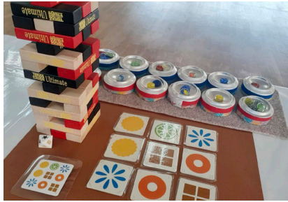
ボードゲームや 卓球も楽しめるよ～

本のコーナーや、ボードゲーム、卓球や工作などいろいろ。あそびに来てね！まってるよ～♪