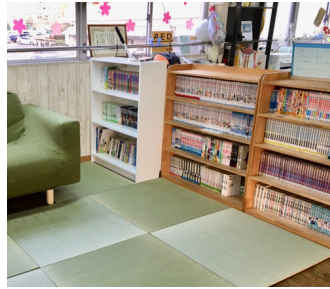
マンガもたくさんあるよ